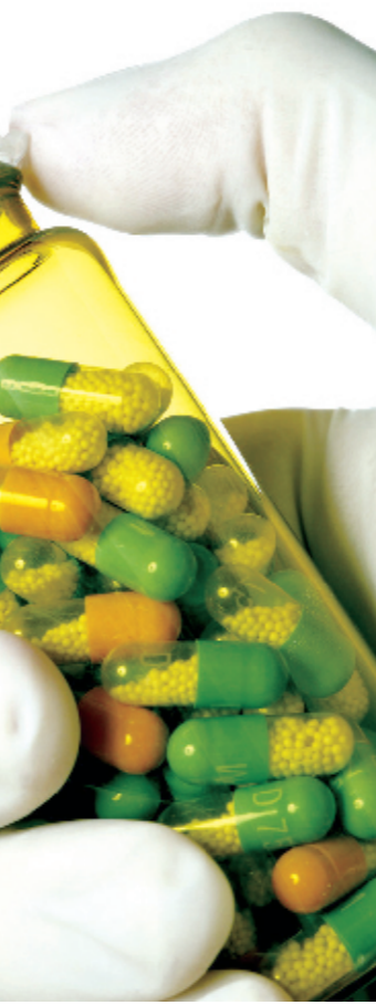
钱恩三人,因在青霉素发现利用方面作出的杰出贡献,共同获得了诺贝尔生理学及医学奖金。