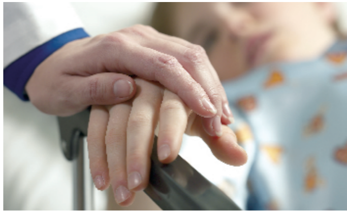
白发人送黑发人,情何以堪?这样的情形怎不叫人心酸?可是这就是生活,生老病死,自然规律,无可选择,不能逃避。(作者供职于新乡市传染病医院)

的母亲蹒跚着到各个窗口办理各种手续。一向我行我素的女儿可以说是众叛亲离,可是她究竟是母亲的心头肉啊!别人不管,母亲要管,没有钱,卖掉了房子也要为她治病。住院一次又一次,女儿到底还是死去了,年近的母亲又一趟趟地奔走和医院和其他部门之间,为她办理种种手续,每每说着话就落泪。此情此景,看着就叫人心痛。